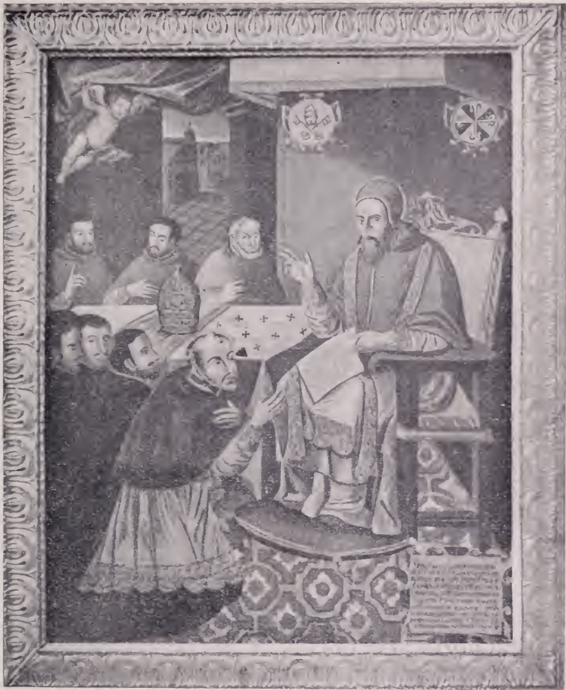
Este curioso cuadro del pintor colonial José Garzón (1723), que se encuentra en la sacristía de la Catedral de Bogotá, representa la erección de la iglesia en metropolitana. Fray Juan de los Barrios, de rodillas y en compañía de tres capitulares, recibe de San Pío V, acompañado de tres cardenales, la bula de erección. Hay un error histórico, pues la erección fue hecha por Pío IV. En el fondo puede verse la antigua catedral.